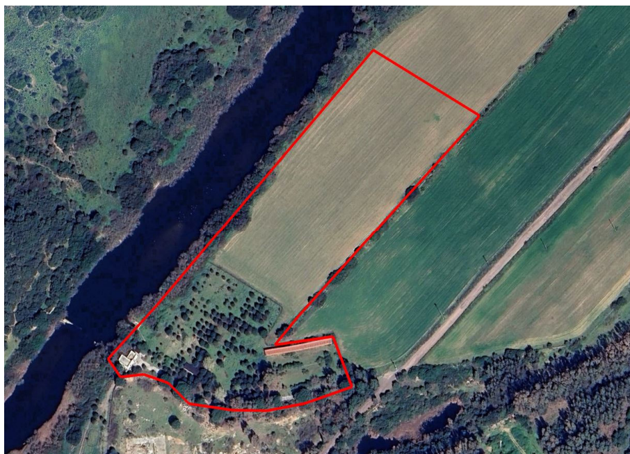
CAMPO DI GARA